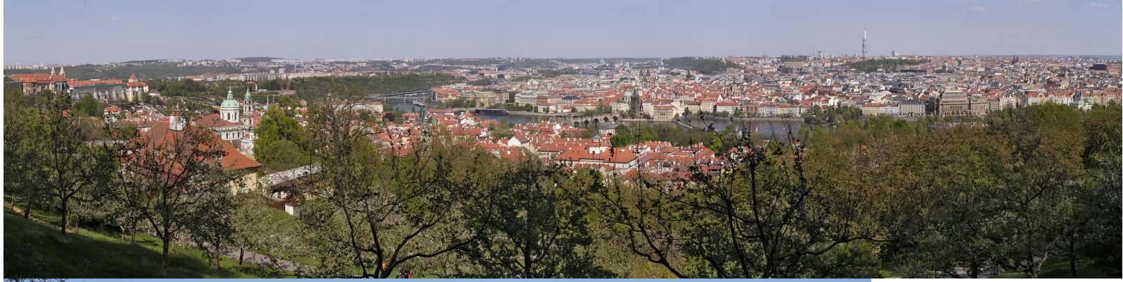
4.6 POHLED Z PETŘÍNSKÝCH SADŮ

50°04'58.44" N – 14°23'59.89" E 50 mm 104° 2020/04/27 – 15:39