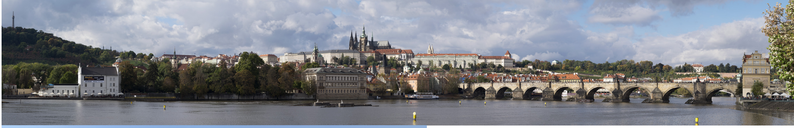
5.7 POHLED ZE SMETANOVA NÁBŘEŽÍ

50°05'01.00" N — 14°24'47.35" E 2014/10/16 — 14:23 88 mm 94°