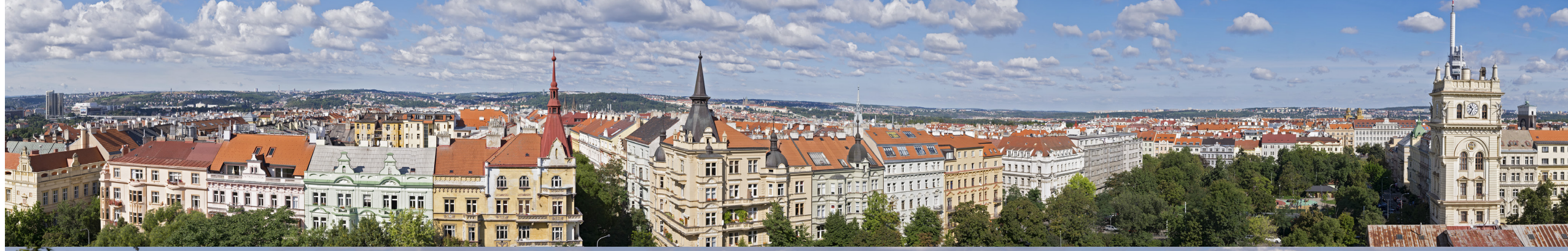
2.2 POHLED Z VĚŽE HUSOVA SBORU NA VINOHRADECH

50°4'27.40" N — 14°26'55.45" E 105 mm 2015/09/08 — 9:32 108°