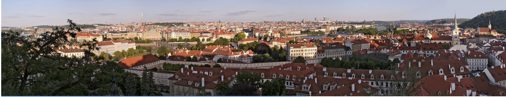
4.3 POHLED Z BARBAKÁNU PRAŽSKÉHO HRADU

50°05'33.04" N — 14°25'25.13" E 2020/06/01 — 20:03 50 mm 126°