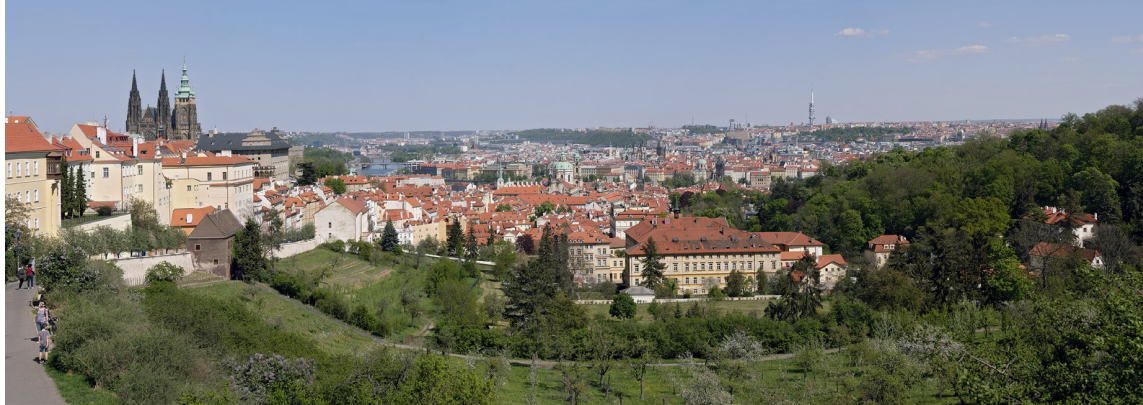
4.5 POHLED OD STRAHOVSKÉHO KLÁŠTERA

50°05'25.39" N — 14°23'28.92" E 2020/04/27 — 15:11 50 mm 74°