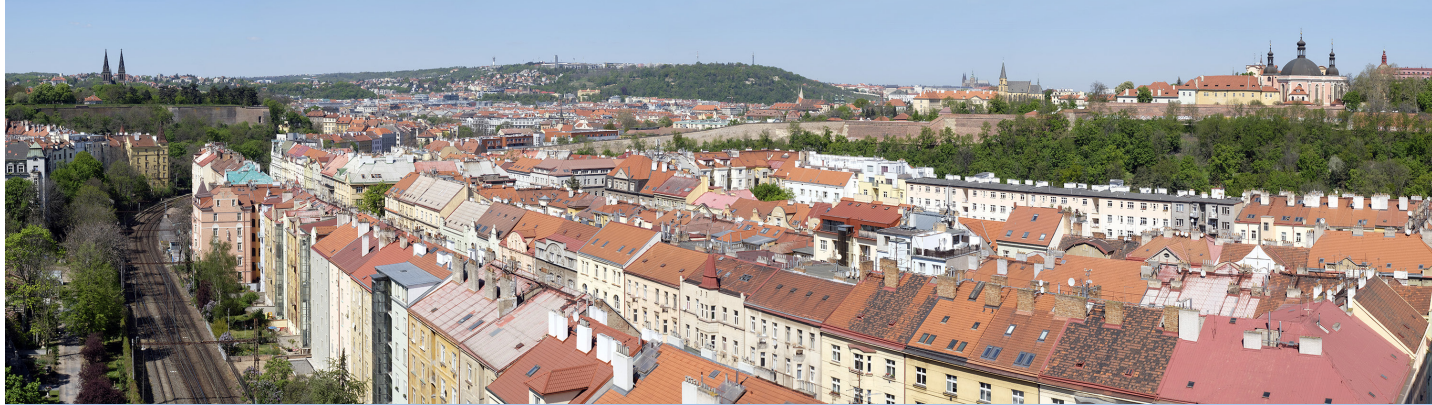
4.11 POHLED Z JIŽNÍHO PŘEDPOLÍ NUSELSKÉHO MOSTU

50°03'54.47" N – 14°25'53.29" E 2020/04/27 – 11:56 50 mm 86°