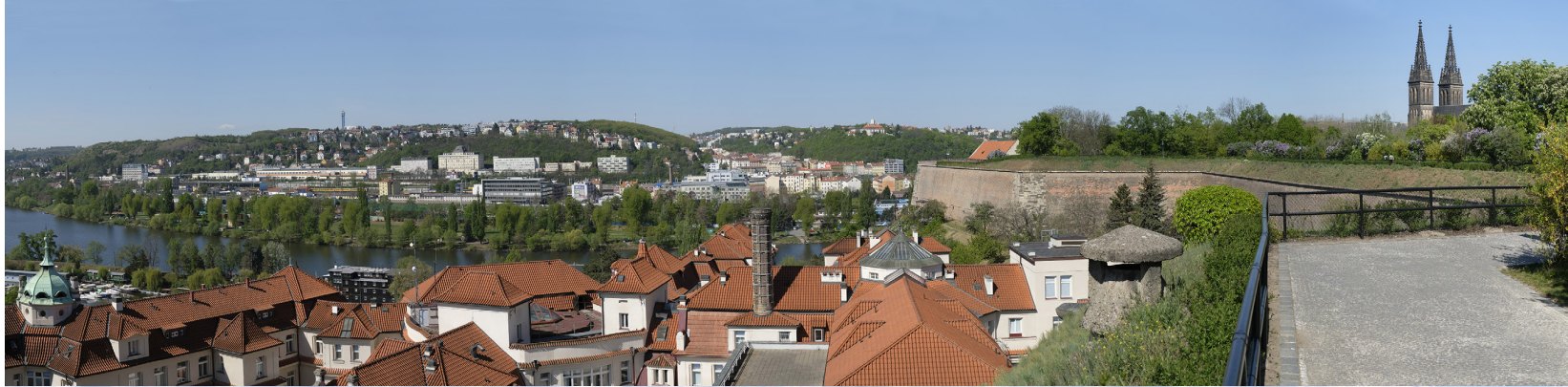
4.8 POHLED Z JIŽNÍHO BASTIONU HRADEB VYŠEHRADU

50°03'47.47" N – 14°25'19.05" E 50 mm 104° 2020/27/04 – 10:16