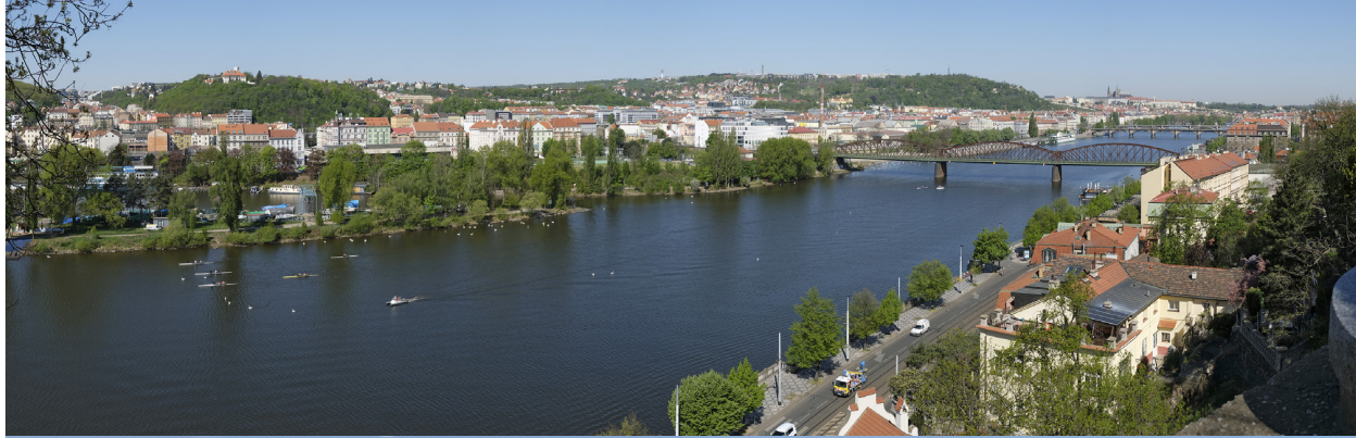
4.7 POHLED Z VYHLÍDKY NA SCHODIŠTI Z VYŠEHRADU

50°03'57.07" N – 14°25'01.69" E 35 mm 130° 2020/04/27 – 10:55