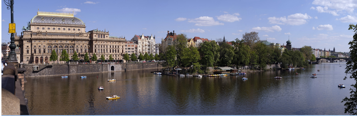
5.9 POHLED Z MOSTU LEGIÍ PROTI PROUDU

50°04'55.58" N — 14°24'41.88" E 2020/04/27 — 16:02 50 mm 85°