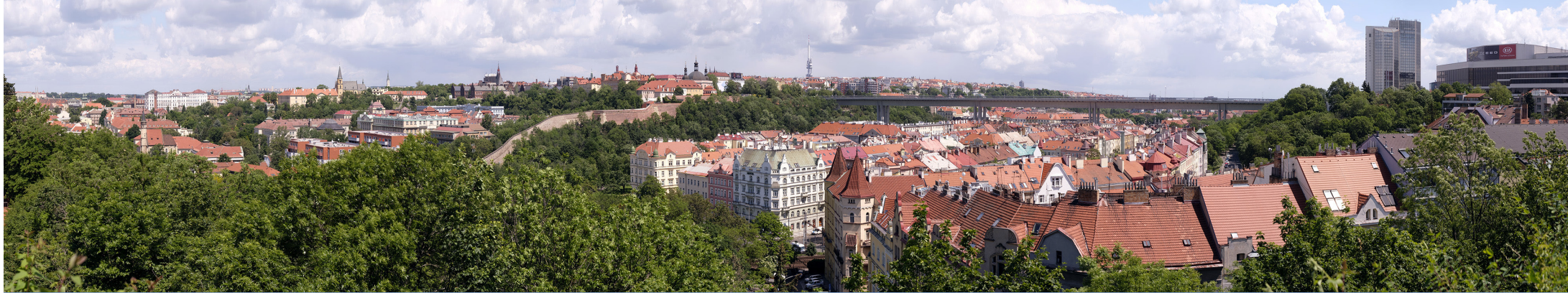
4.9 POHLED Z VÝCHODNÍCH HRADEB VYŠEHRADU

50°03'53.07" N – 14°25'23.41" E 50 mm 144° 2020/05/24 – 12:47