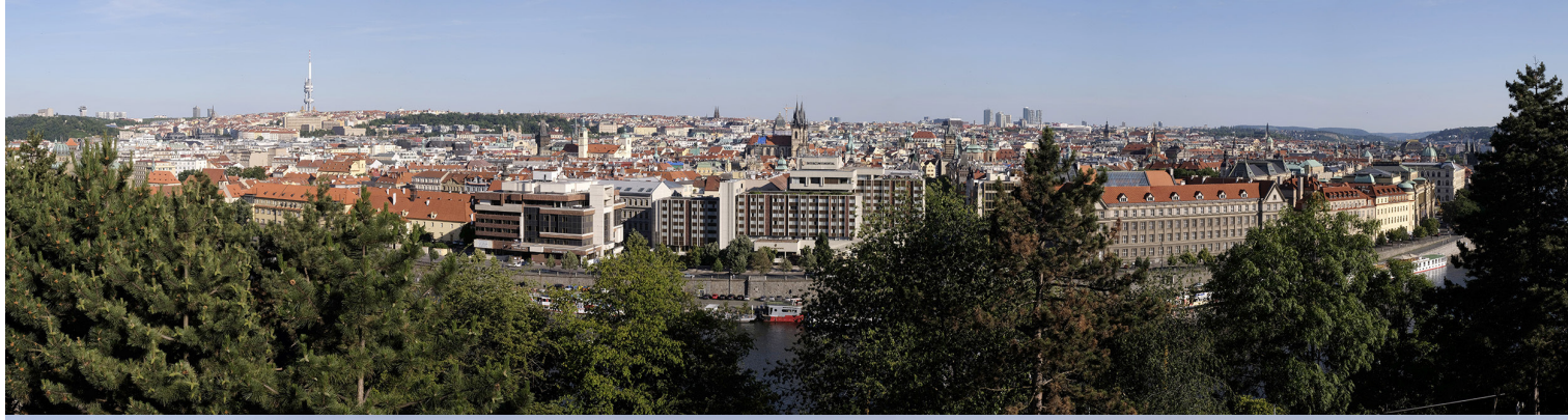
4.2 POHLED Z LETENSKÝCH SADŮ OD METRONOMU

50°05'43.80" N — 14°25'01.34" E 2020/06/14 — 17:19 50 mm 100°