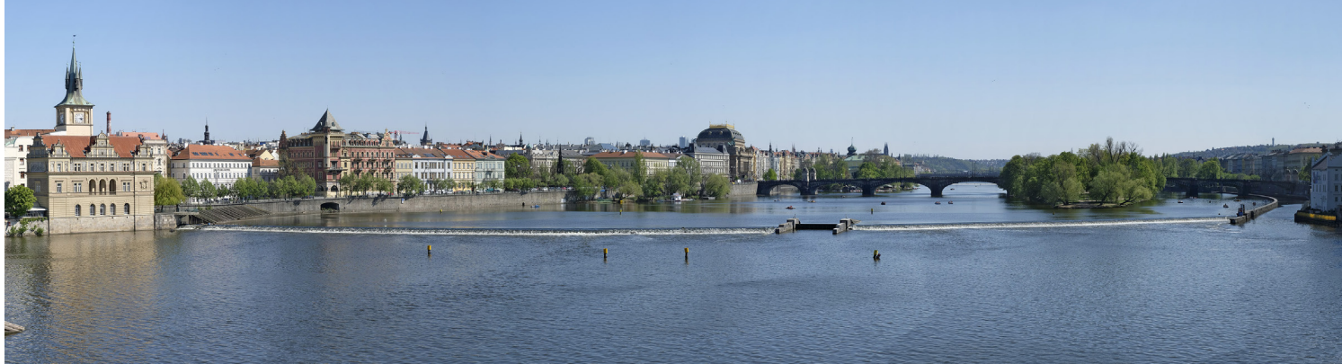
5.5 POHLED Z KARLOVA MOSTU PROTI PROUDU

50°05'14.16" N – 14°24'45.16" E 2020/04/22 – 15:39 50 mm 132°