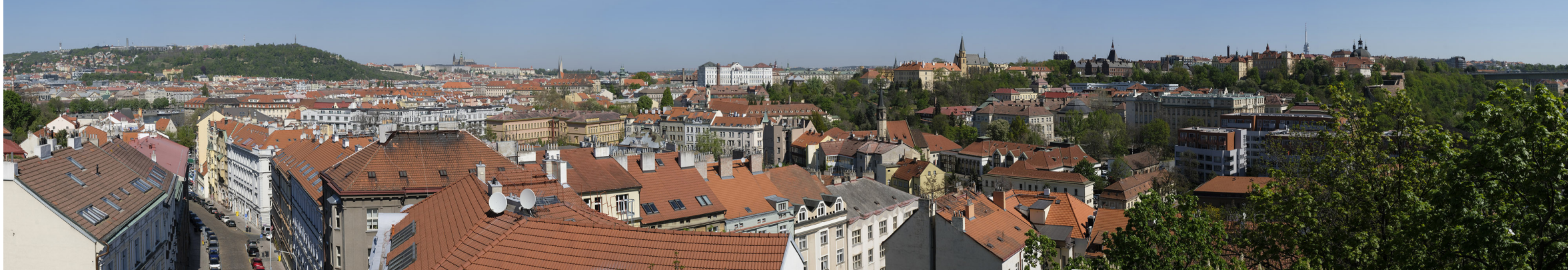
4.10 POHLED ZE SEVERNÍHO BASTIONU HRADEB VYŠEHRADU

50°03'58.58" N – 14°25'19.07" E 50 mm 157° 2020/04/27 – 11:19