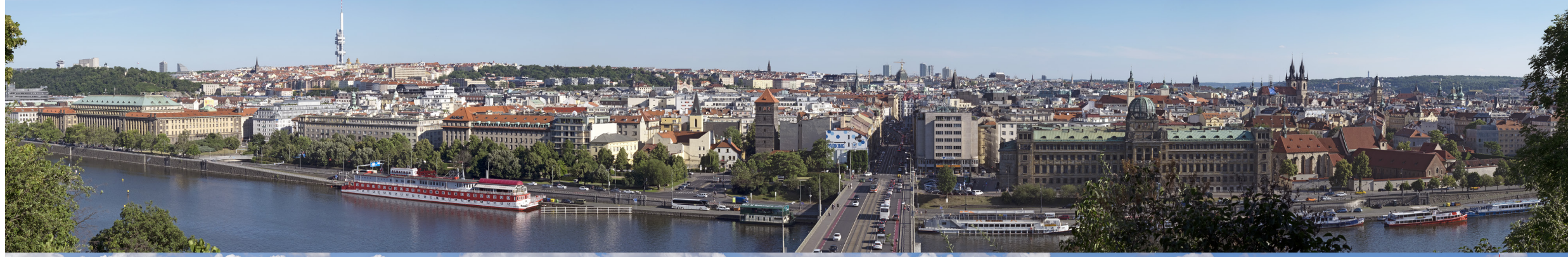
2.1 POHLED Z LETENSKÝCH SADŮ OD LETENSKÉHO ZÁMEČKU

50°05'45.50" N — 14°25'35.30" E 50 mm 2017/06/14 — 17:03 104°