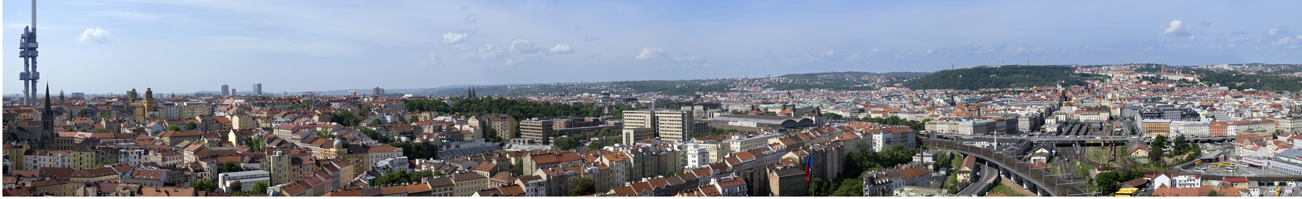
1.3 POHLED ZE STŘECHY NÁRODNÍHO PAMÁTNÍKU NA VÍTKOVĚ

50°05'18.80" N – 14°26'58.45" E 2015/05/22 – 13:07 50 mm 127°