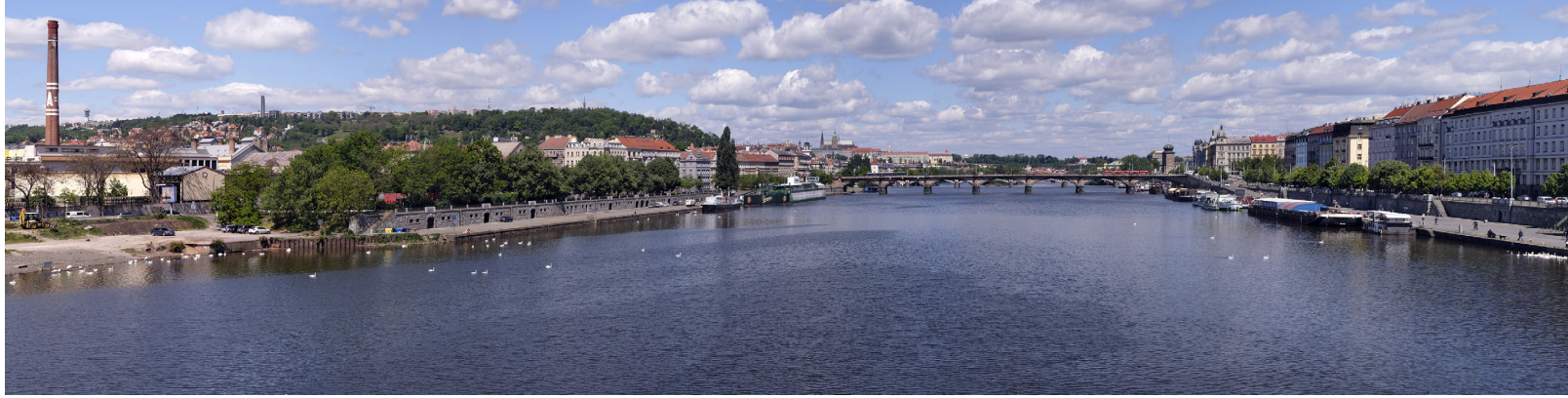
5.13 POHLED Z ŽELEZNIČNÍHO MOSTU PO PROUDU

50°04'03.86" N – 14°24'52.09" E 2020/05/12 – 12:18 50 mm 84°