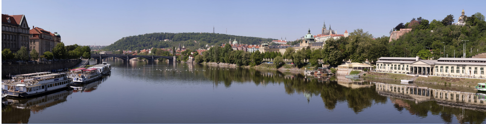
5.2 POHLED Z ČECHOVA MOSTU

50°05'37.51" N – 14°25'05.07" E 2020/05/19 – 10:28 50 mm 93°