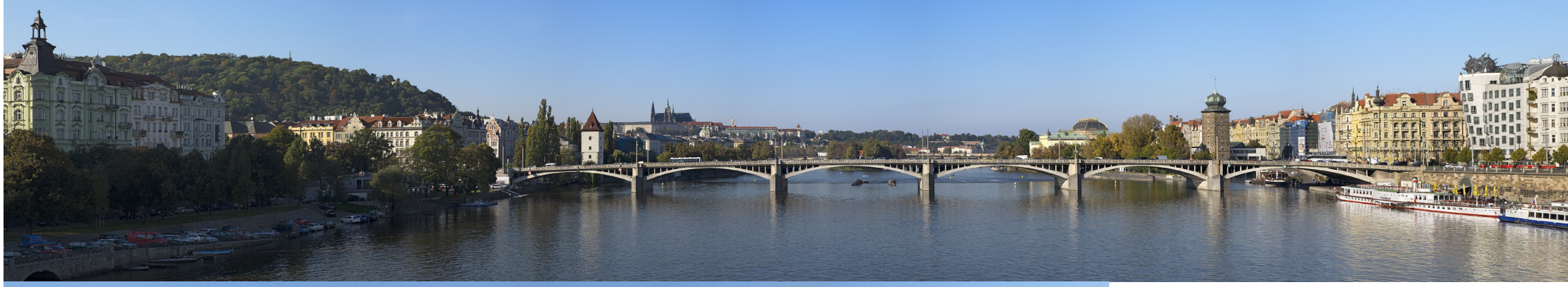
5.11 POHLED Z PALACKÉHO MOSTU PO PROUDU

50°04'21.45" N – 14°24'38.05" E 2014/10/09 – 15:46 55 mm 70°