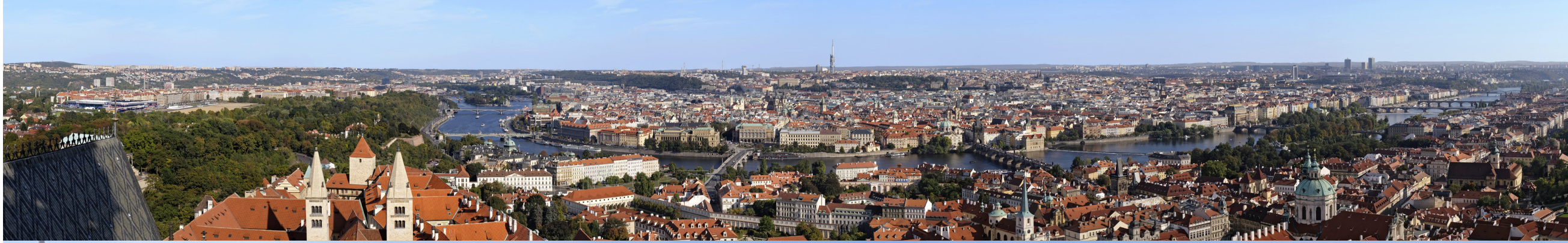
1.2 POHLED Z KATEDRÁLY SV. VÍTA

50°05'26.45" N – 14°24'1.90" E 2015/10/01 – 14:32 50 mm 129°