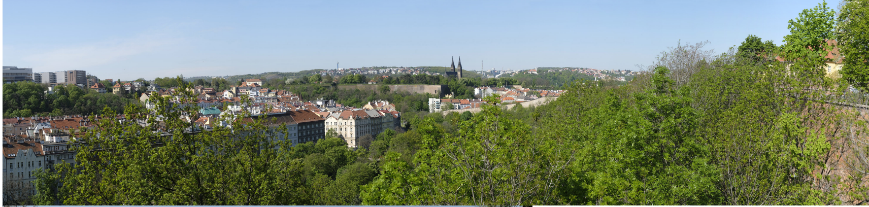
4.12 POHLED ZE SEVERNÍHO PŘEDPOLÍ NUSELSKÉHO MOSTU

50°04'08.56" N – 14°25'52.06" E 2020/27/04 – 10:03 50 mm 91°