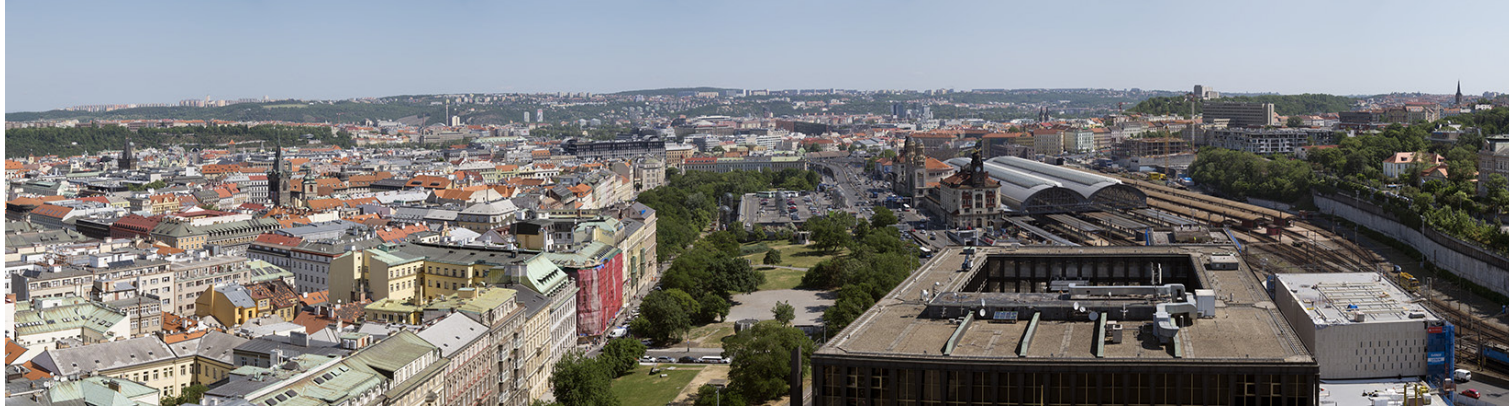
50°04'48.02" N – 14°25'52.77" E 2018/05/21 – 9:33 50 mm 254°