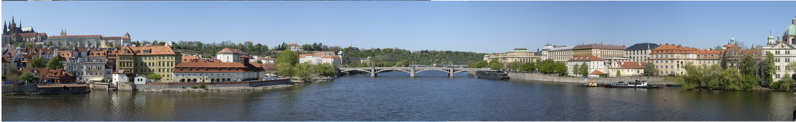
5.4 POHLED Z KARLOVA MOSTU PO PROUDU

50°05'14.16" N – 14°24'45.16" E 2020/04/22 – 15:44 50 mm 157°