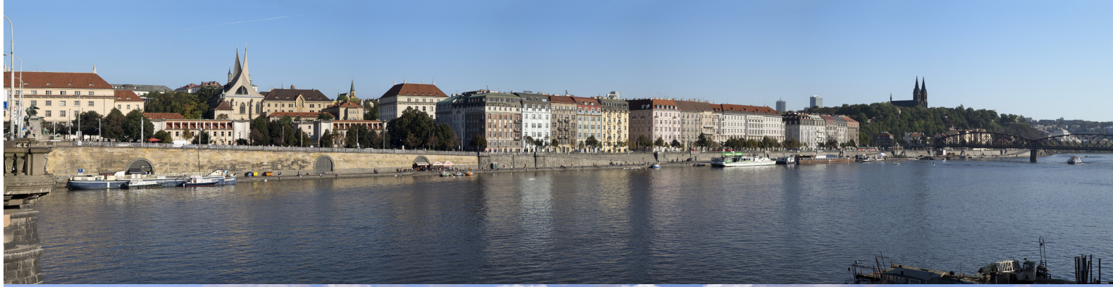
5.12 POHLED Z PALACKÉHO MOSTU PROTI PROUDU

50°04'21.45" N – 14°24'38.05" E 2014/10/09 – 15:43 55 mm 88°