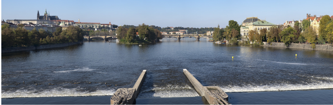
5.10 POHLED Z JIRÁSKOVA MOSTU PO PROUDU

50°04'34.75" N — 14°24'43.78" E 2014/10/09 — 15:24 55 mm 61°