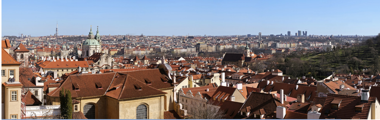
4.4 POHLED Z RAMPY PRAŽSKÉHO HRADU

50°05'20.70" N — 14°23'54.80" E 2017/28/03 — 14:40 50 mm 76°