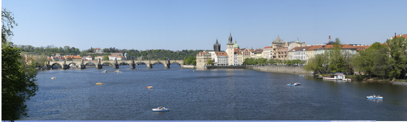
5.8 POHLED Z MOSTU LEGIÍ PO PROUDU

50°04'55.58" N — 14°24'41.88" E 2020/04/22 — 16:04 50 mm 65°