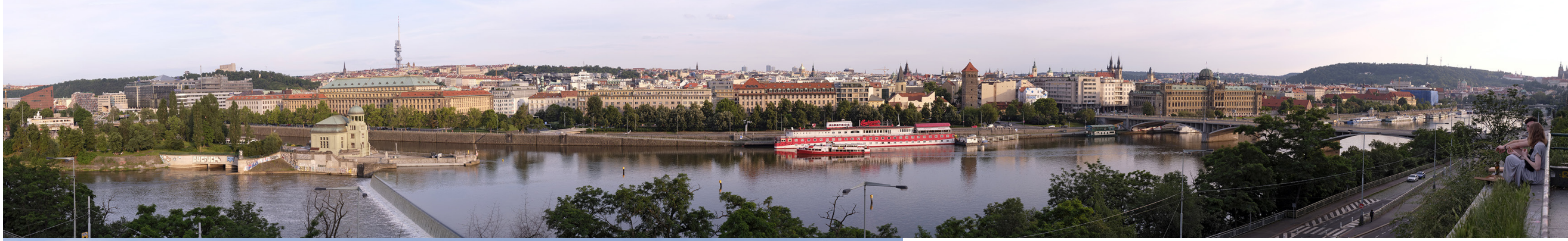
4.1 POHLED OD RESTAURAČNÍHO PAVILONU PRAHA — EXPO 58

50°05'49.07" N — 14°25'52.28" E 2020/06/15 — 20:02 50 mm 158°