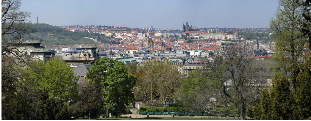
4.13 POHLED Z RIEGROVÝCH SADŮ

50°04'49.65" N – 14°26'28.73" E 2020/04/22 – 12:31 93 mm 35°