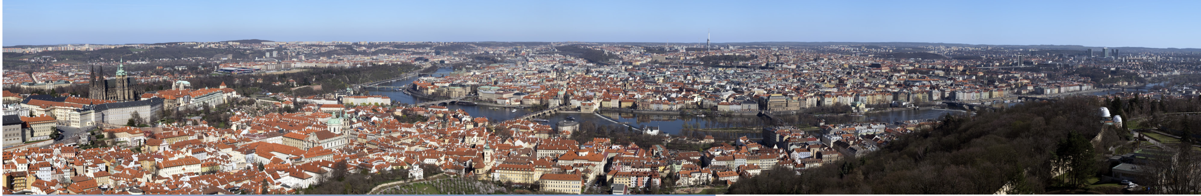
50°05'0.75" N – 14°23'42.30" E 2017/03/28 – 14:19 50 mm 143°