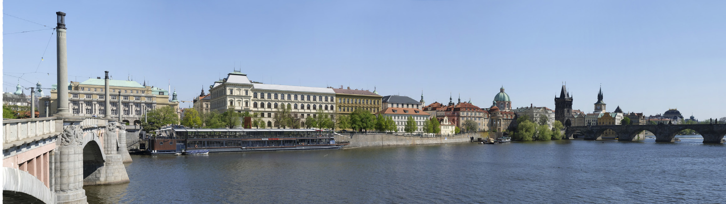
5.3 POHLED Z MÁNEŠOVA MOSTU PROTI PROUDU

50°05'25.25" N – 14°24'45.07" E 2020/04/22 – 15:22 50 mm 113°