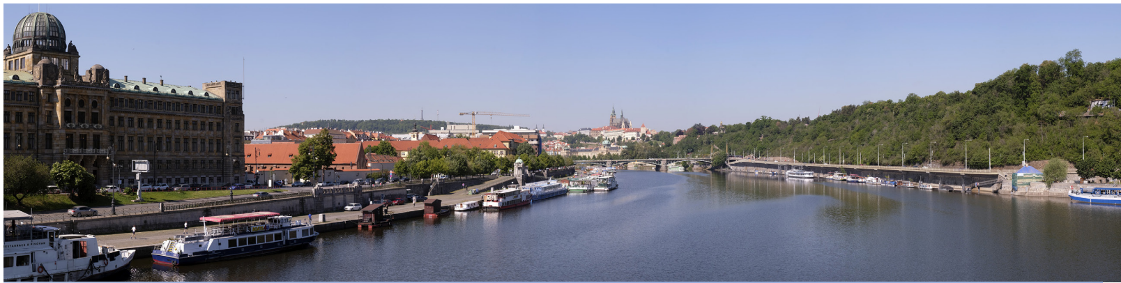
5.1 POHLED ZE ŠTEFÁNIKOVA MOSTU

50°05'42.08" N – 14°25'40.72" E 2020/05/19 – 10:10 50 mm 91°