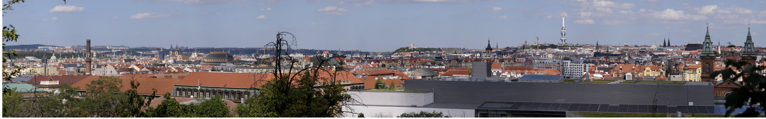
2.3 POHLED Z PARKU SACRÉ COEUR

50°04'23.95" N — 14°23'58.95" E 135 mm 2017/08/05 — 14:45 65°